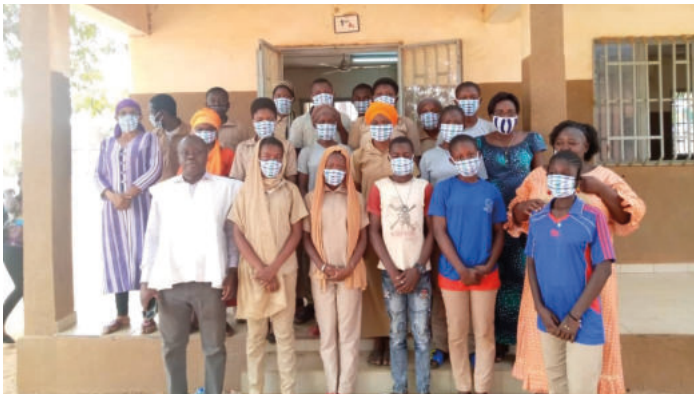
Crédit photo : ADEP Ouagadougou, mars 2021 : Première cohorte du Lycée Vénégré, Programme d'éveil à l'entrepreneuriat.

Projet financé par Affaires mondiales Canada