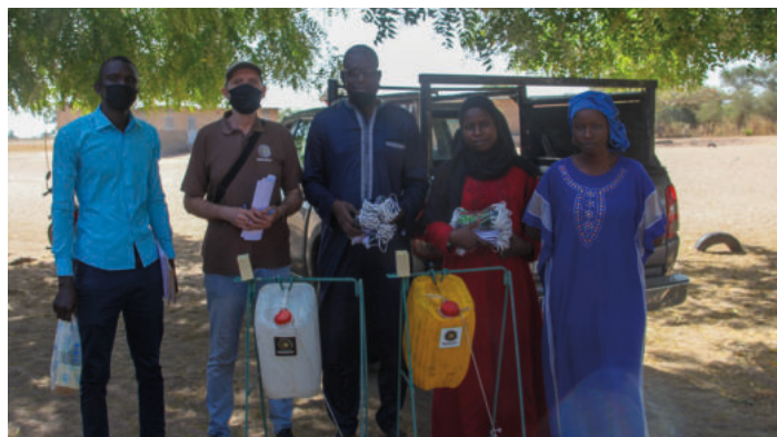
Crédit photo : Nébédáy Toubacouta, 19 mars 2021 : Don de masques réutilisables et de stations de lavage de main, à l'école Keur Elimane.

L'appui du MRIF aura permis à l'association sénégalaise Nébédáy de renforcer les capacités des membres de son équipe sur des outils financiers et de gestion de projets. Il aura également