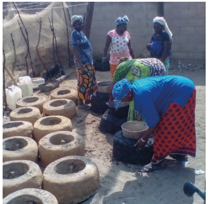
Bassar : Formation sur les foyers améliorés avec les femmes de la communauté de Bassar.

Cette dernière année aura débuté sous la pandémie, ce qui a conduit le CSI à prolonger le projet de quatre mois, reportant sa fin au mois de décembre 2020. En février 2020, deux stagiaires PSIJ ont rejoint Nébéday pour mettre en place le plan de commercialisation des produits des filières des îles du Saloum et accompagner le partenaire dans le suivi-évaluation du projet. Malheureusement le contexte a contraint les stagiaires à revenir prématurément au Québec, ne permettant pas la poursuite de la mise en œuvre du plan de commercialisation. Toutefois, les autres activités ont pu redémarrer au courant de l'été 2020, ce qui a permis de finaliser la construction des fumoirs améliorés dans les villages de Thialane et Bassoul, de construire une unité de transformation des produits forestiers non ligneux pour les femmes de Bassar et de poursuivre les campagnes de reboise-