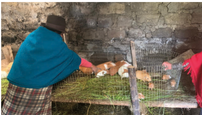
Crédit photo : Fondation MARCO, Canton de Colta, province du Chimborazo.

Ce projet est financé par le ministère des Relations internationales et de la Francophonie du Québec, la Fondation Internationale Roncalli et la Fondation Louise Grenier. Ce projet en partenariat avec la Fondation MARCO vise à renforcer les chaînes de valeur du cochon d'Inde et du lait pour augmenter la prospérité économique des huit communautés de la Corporación de Organizaciones Campesinas Indígenas de la Huaconas y Culluctus (COCIHC) du canton de Colta. Certains ateliers et activités initialement prévus ont été reportés à cause de la crise sanitaire. Malgré le contexte actuel, la Fondation MARCO a réussi à renforcer les capacités des producteurs et productrices du cochon d'Inde et du lait par le biais de l'amélioration de la qualité du lait de 70 %, la création d'un nouveau produit (fromage mozzarella), la restauration des pâturages pour améliorer la nutrition des espèces d'élevage et un accord conclu pour la vente des produits avec le plus gros marché de Riobamba.