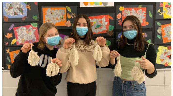
Participant au projet, activité de macramé

Le CSI s'est vu également octroyer un montant de 75 000$ pour le projet Broder la solidarité! Ce projet, toujours en cours, vise à initier un dialogue intergénérationnel positif entre jeunes et moins jeunes sur le thème des savoirs traditionnels, notamment sur le thème de la couture et de l'impact de l'industrie du textile sur la planète et sur les inégalités sociales. Au cours du projet, des liens ont été tissés sur la manière de se procurer des vêtements à l'époque, sur la manière de les confectionner versus aujourd'hui. On a abordé l'impact social et environnemental de l'industrie du textile partout sur la planète en explorant des pistes de solutions à l'échelle individuelle et collective. De plus, les jeunes ont eu la chance de vivre une activité concrète en réalisant des plumes en macramé colorées avec des teintures écologiques. Un volet d'échange virtuel a été réalisé avec des personnes aînées dans le but de sensibiliser les jeunes à l'importance des savoirs traditionnels tout en donnant une voix de partage d'expérience aux personnes aînées. Un outil de sensibilisation sera produit sous la forme d'un recueil de témoignages entre générations sur les thématiques abordées dans le projet. À ce jour, avec la collaboration