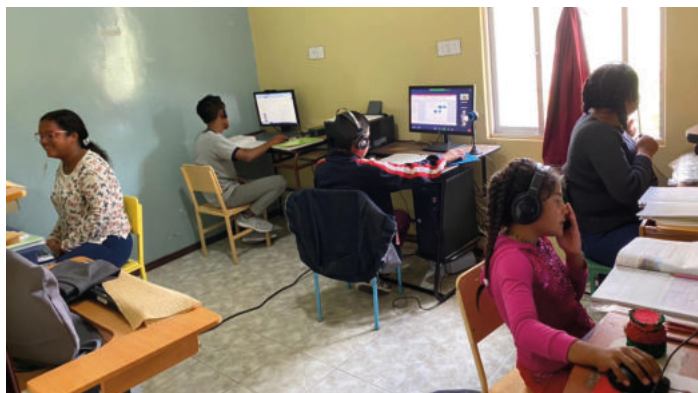
San Antonio de Pichincha, mars 2020 : Les enfants utilisant le centre informatique

Partenaire du CSI depuis 2017 dans le cadre des stages, la Fondation Pueblito La Ternura a été soutenue à travers le PSOCI afin de lui permettre de poursuivre sa mission de scolarisation et d'accompagnement d'enfants de 3 à 12 ans issus de familles vulnérables ou victimes de violence. L'offre de cours a pu être maintenue avec la prise en charge des salaires du personnel enseignant, l'équipement d'un centre informatique et une contribution à la