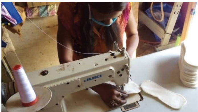
Crédit photo : ANPD Guédiawaye, mars 2021 : Confection de serviettes hygiéniques lavables.

Ce sont quatre emplois qui ont été maintenus à l'ANPD grâce au soutien financier du MRIF, en plus de l'appui à une programmation d'activités en réponse à la crise COVID-19, en promotion de la santé, de l'hygiène et de l'égalité de genre et en soutien à des activités génératrices de revenus. Après une formation sur les gestes barrières et sur les conséquences des inégalités de genre sur les filles en période de crise, les animateurs et animatrices ont sillonné les quartiers d'intervention pour aller à la rencontre des groupements de femmes. Ces causeries éducatives ont permis de rejoindre 150 femmes. Un accompagnement a également été offert à des jeunes femmes en situation précaire. En plus des sensibilisations, elles se sont vu remettre des kits de protection individuelle ainsi que des serviettes hygiéniques lavables. Au total, 500 serviettes ont été commandées à des jeunes femmes couturières qui avaient été soutenues dans nos projets antérieurs, et ont été remises aux 238 jeunes femmes en situation précaire. Les serviettes hygiéniques lavables ont suscité un engouement auprès de celles-ci, mais également auprès de représentant.es des services de la santé et de la jeunesse dans le département de Guédiawaye.